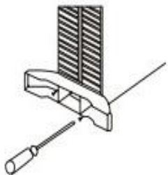
Рис. 1. Напольная установка