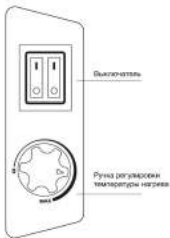
Рис. 4. Панель управления